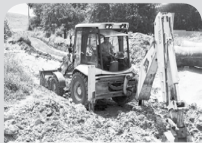
Идёт укладка труб в станице Бекешевская.

Когда шли сильные ливневые дожди, подворья станичников Бекешевской сильно пострадали.