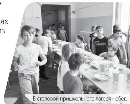
В столовой пришкольного лагеря - обед.