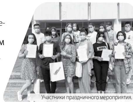
Участники праздничного мероприятия.