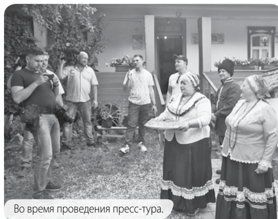
Во время проведения пресс-тура.

Гости побывали в этнографическом подворье «Жар-птица» у казаков-некрасовцев села Садовое, а также в станице Боргустанская в одном из первых казачьих домов, ставшем сегодня туристско-экскурсионным этнографическим центром «Казачье подворье». Народные традиции и блюда позволили журналистам насладиться казачьим гостеприимством.