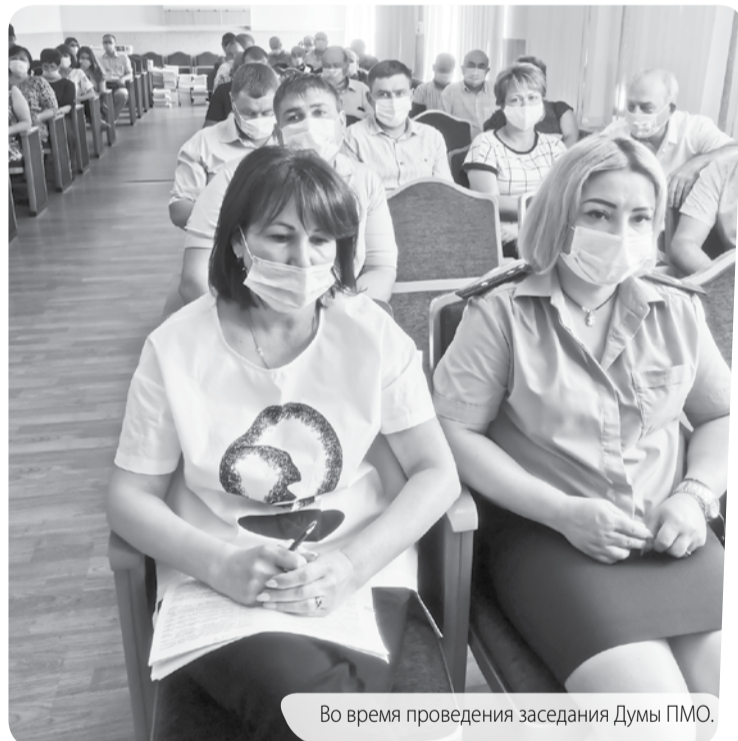
Во время проведения заседания Думы ПМО.